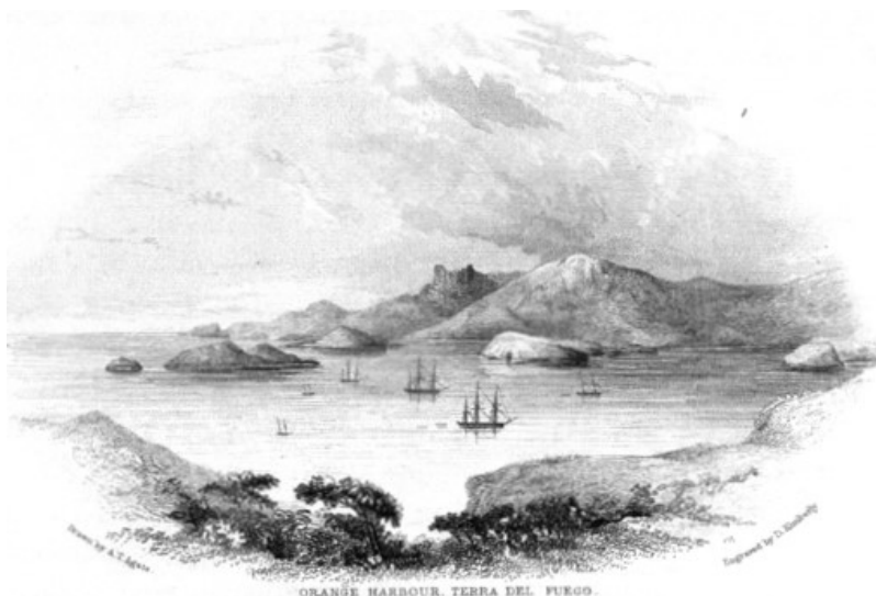
Navios da U. S. Exploring Expedition em Orange Harbour, Terra do Fogo.

Ainda que o foco fosse no Pacífico por parte de todos os envolvidos nas voltas ao mundo, a expedição norte-americana, entre outras, se demorou no Atlântico, onde procedeu levantamento hidrográfico e refez mapas inconsistentes. O trabalho resultante era realizado tendo como base os relatos de viagem de outros oficiais, particularmente os dos europeus, que haviam inicialmente levantado acidentes submersos ou costas. A narrativa de viagem da expedição, simultaneamente, reconhecia os feitos dos europeus, em especial os da Inglaterra, maior marinha da época, e firmava os Estados Unidos como interlocutores no debate científico internacional.