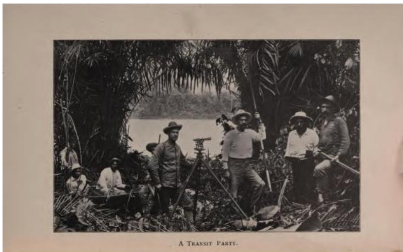
Fotografia da exploração de WALKER

Desde a década de 1880, era certo, para eles, que construiriam o canal, mas permanecia a dúvida se seria no Panamá ou na Nicarágua. Duas expedições foram realizadas por James Grimmes Walker que presidiu a Nicarágua Canal Commission e depois a Isthmian Canal Commission . Os relatórios de viagem produzidos por Walker foram imprescindíveis para que os norte-americanos decidissem pelo Panamá, descartando a passagem pela Nicarágua.