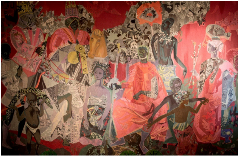
Tapisserie de la grande salle de la Résidence