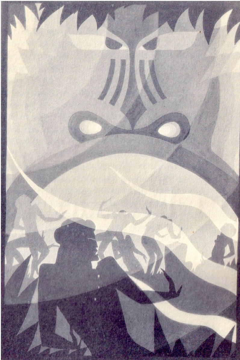
Aaron Douglas, illustration pour l'édition anglaise de Magie noire , de Paul Morand, (1930)

Dès lors, on imagine que la question se pose avec une acuité plus sensible encore s'agissant du français. Jusqu'à quel point cet idiome a-t-il été en mesure de prendre en charge le jazz ? Quel impact celui-ci a-t-il pu avoir sur la langue de Racine, à supposer qu'une telle influence soit même imaginable ?