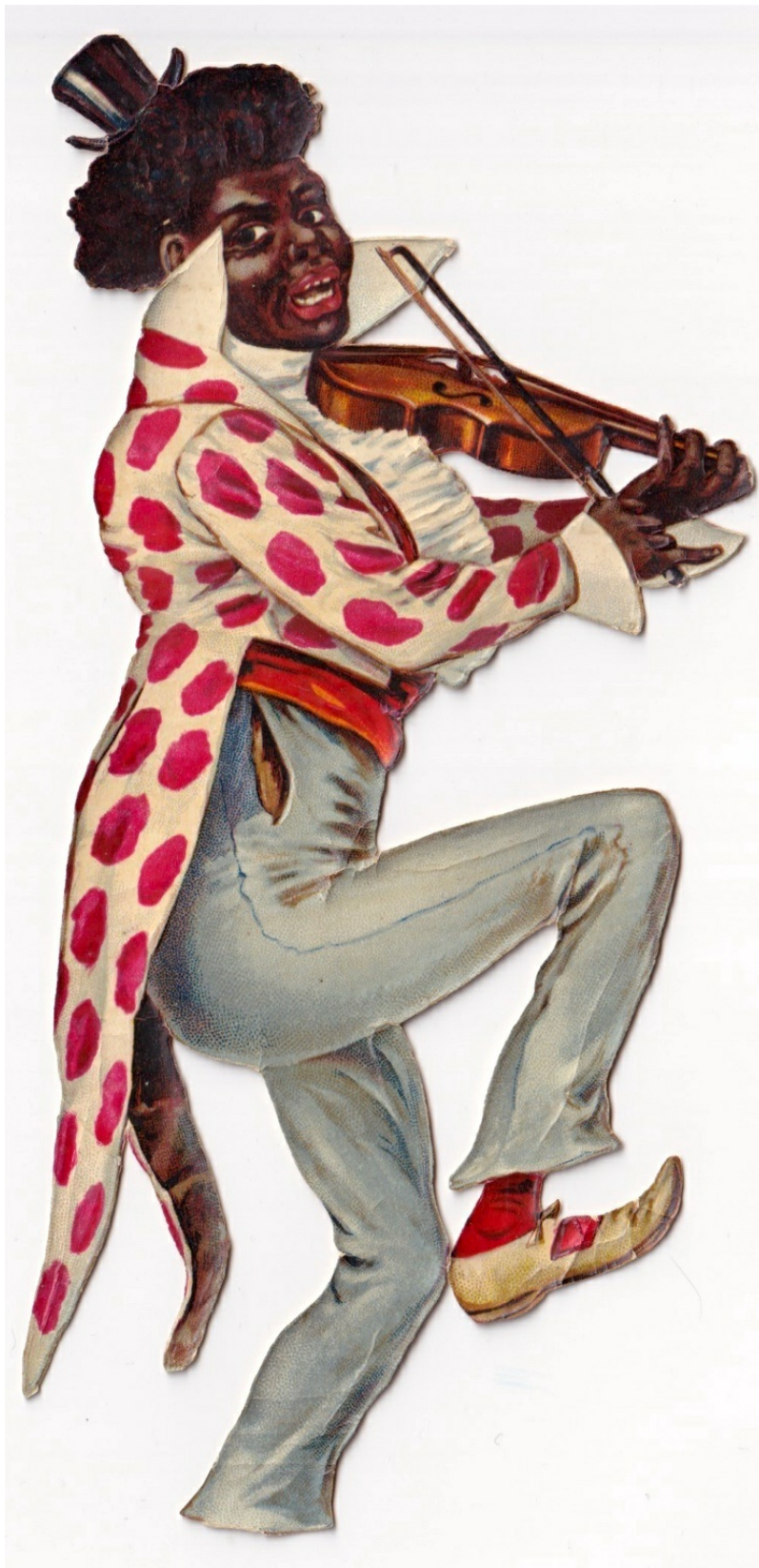
Minstrel , Chromolithographie, circa 1910