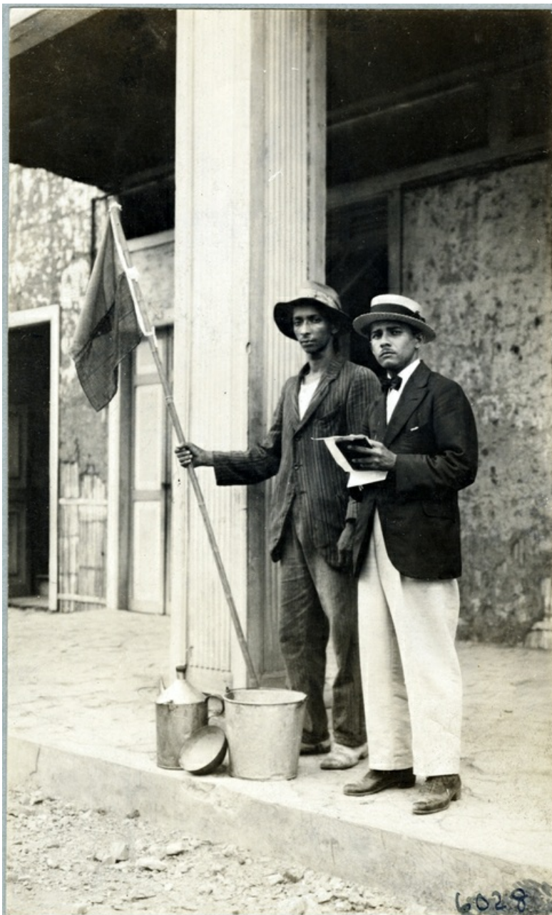
“Sanitary squad with full equipment, Yellow Fever control”, Guayaquil

La politique rockefellerienne se manifeste d'abord dans le domaine de la santé publique, notamment en Amérique latine où la fondation lance dès 1916 des enquêtes sanitaires dans de nombreux pays, suivies de campagnes destinées à éradiquer certaines maladies telles que l'ankylostomiase, le paludisme ou la fièvre jaune. Les plus importantes ont lieu au Brésil (1923-1940), en Argentine (1920-1929), en Colombie (1920-1929) ou encore au Venezuela (1927-1928).