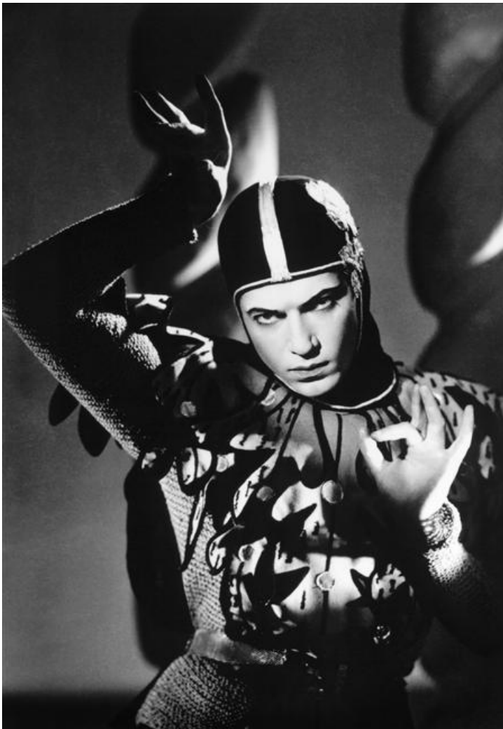
Serge Lifar dans « Le Chevalier et la Damselle », 1941

À l'étranger, danseuses et danseurs endossent un double rôle d'ambassadeurs et de passeurs culturels : non seulement ils incarnent la France sur les scènes étrangères — la Marseillaise est ainsi jouée à chaque première et dernière dans les villes visitées —, mais les tournées constituent également des étapes importantes dans leur carrière, où ils peuvent expérimenter de nouvelles distributions et acquérir une notoriété inédite. Elles sont l'occasion d'échanger des savoir-faire entre danseurs de compagnies concurrentes qui suivent parfois des cours en commun comme à Broadway ou à la School of American Ballet à New York. Claude Bessy, alors danseuse du corps de ballet de tout juste 16 ans et plus tard directrice de l'école de ballet de l'Opéra de Paris, se souvient des années plus tard de son enthousiasme : « La liberté est à moi. Après des années de privations, je découvre l'abondance, les boutiques, les nourritures appétissantes et copieuses, les parades et les fêtes de rue, la mythique Amérique 7 . » Car la destination américaine charrie incontestablement avec elle son lot de désirs, de rêves et d'émancipation.