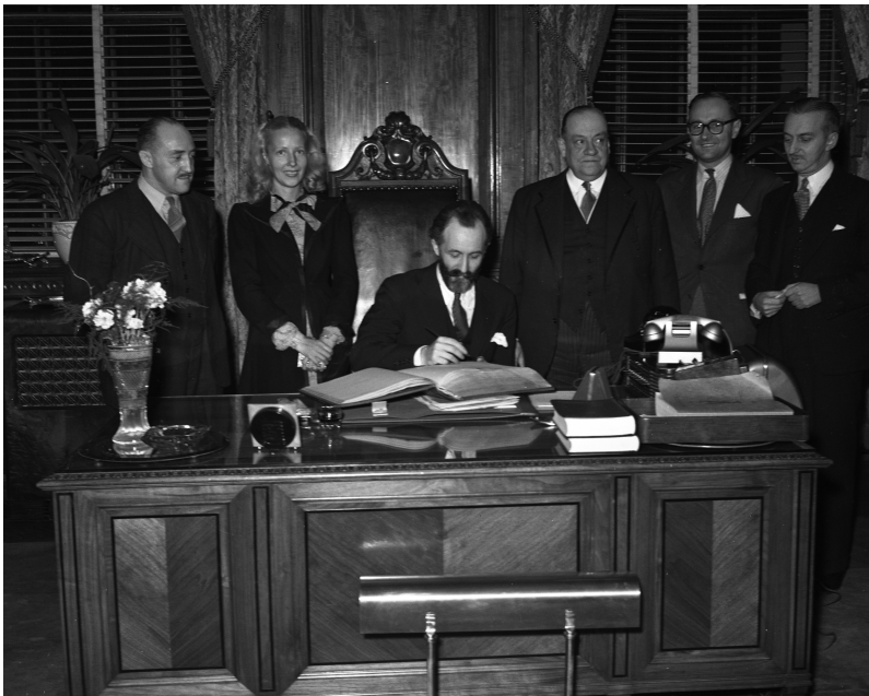
César de Mendoza Lassalle signant un livre d'or à Montréal, 16 octobre 1946