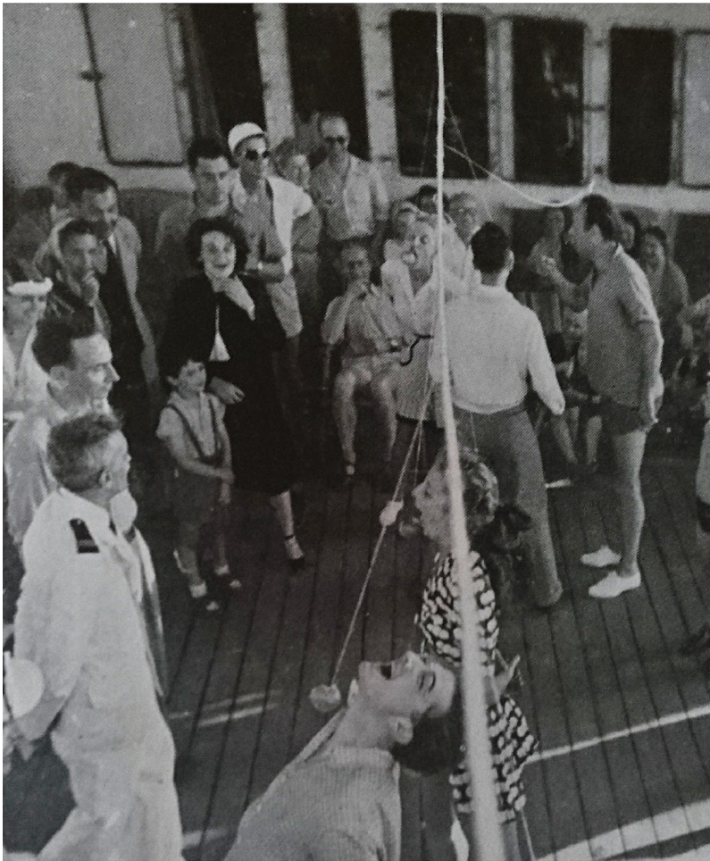
Le jeu de la pomme sur le paquebot lors de la traversée de l'Atlantique par le ballet de l'Opéra de Paris en 1950