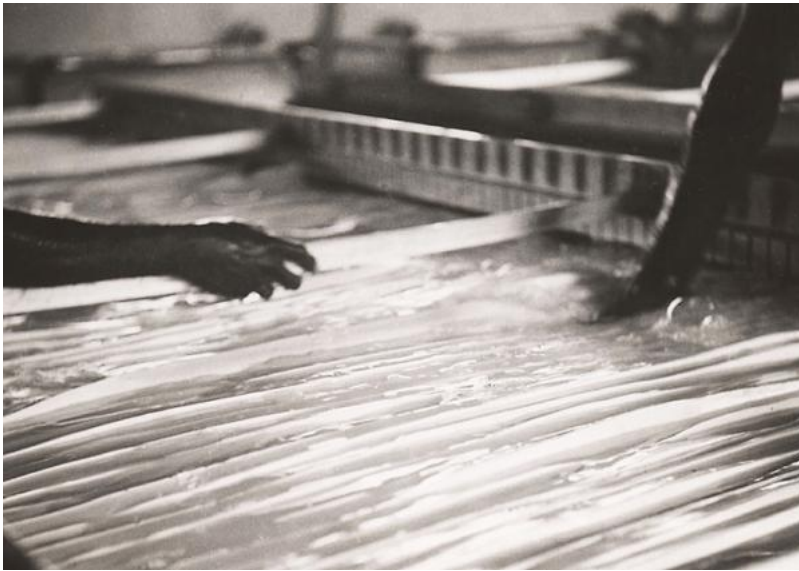
Dizangué, plantation de caoutchouc Sanaga, 1943. La bande de latex déjà coagulée est sortie des cuves. Germaine Krull, tirage argentique collé sur carton 11,5 x 12, ANOM 30Fi60/61

Source : Agence économique de la France d'outre-mer/Gouvernement général de l'Afrique-Équatoriale française