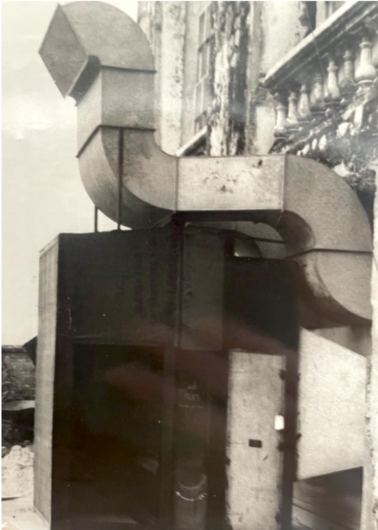
Détail du nouveau Poste Radio, Brazzaville. Ventilation par compression pour la réfrigération de circulation d'eau, Germaine Krull, Service de l'information de la France Combattante en A.F.L. [dossier EP 1285 Boite FOL]

Mais, cela ne veut pas dire qu'il n'existe aucun échange. Germaine Krull, par exemple, continue occasionnellement de photographier dans le sillage de la Nouvelle Vision, proposant sur place une esthétique hybride qui lui est propre.