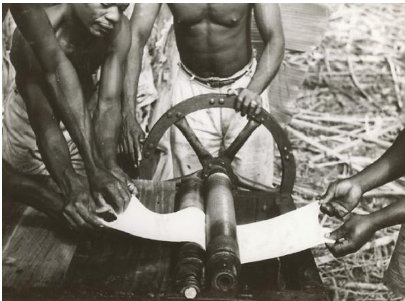
Fabrication de caoutchouc, la masse de latex est essorée, Plantation de caoutchouc Sanaga, 1943, Germaine Krull, 11,5 x 12, ANOM 30Fi60/61

Source : Agence économique de la France d'outre-mer/Gouvernement général de l'Afrique-Équatoriale française