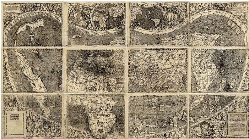
Universalis cosmographia secundum ptholomaei traditionem et americi vespucii aliorumque lustrationes : La mappemonde conçue par Martin Waldseemüller à Saint-Dié en 1507