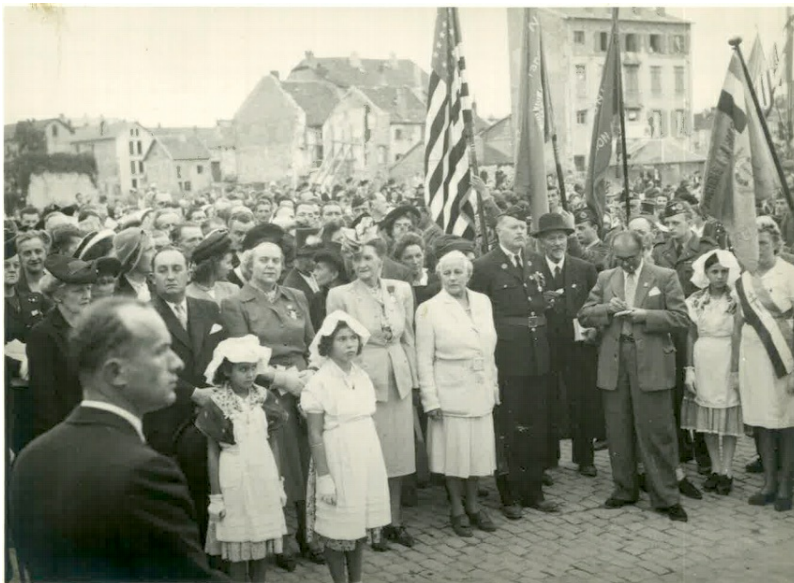
Cérémonie commémorative en présence de l'American Legion à Saint-Dié, 21 septembre 1947

Cette Maison de l'Amérique fait partie des monuments détruits par la Wehrmacht en novembre 1944, même si la façade et ses plaques témoignant de l'amitié avec les États-Unis tiennent encore miraculeusement debout. La municipalité refuse dans un premier temps de la démolir, car il s'agit plus que jamais d'un lieu symbolisant les liens forts entre la ville-martyre et sa prétendue filleule. Plusieurs cérémonies commémoratives se tiennent devant cette façade calcinée en présence de délégations américaines.