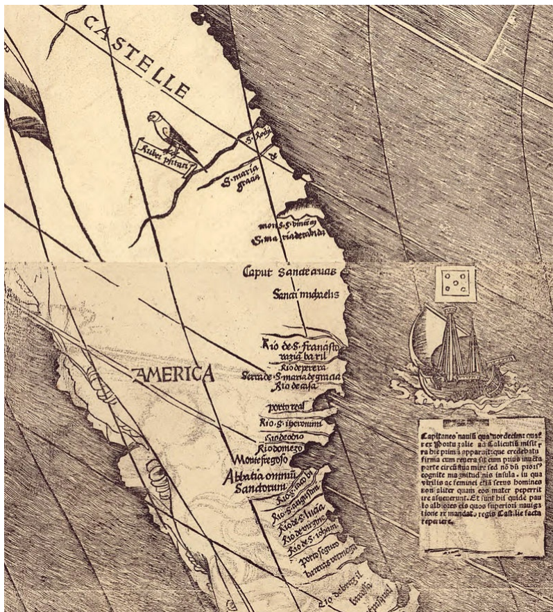
Détail de la mappemonde de 1507, avec la mention du mot America