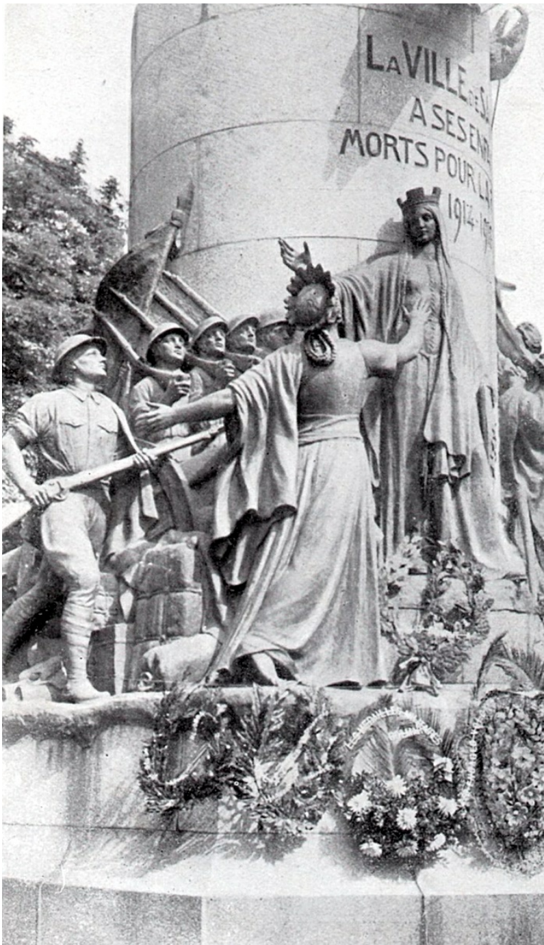
Détail du monument aux morts de Saint-Dié-des-Vosges par Charles Desvergnès, inauguré en 1928, L'Illustration , 29 octobre 1938