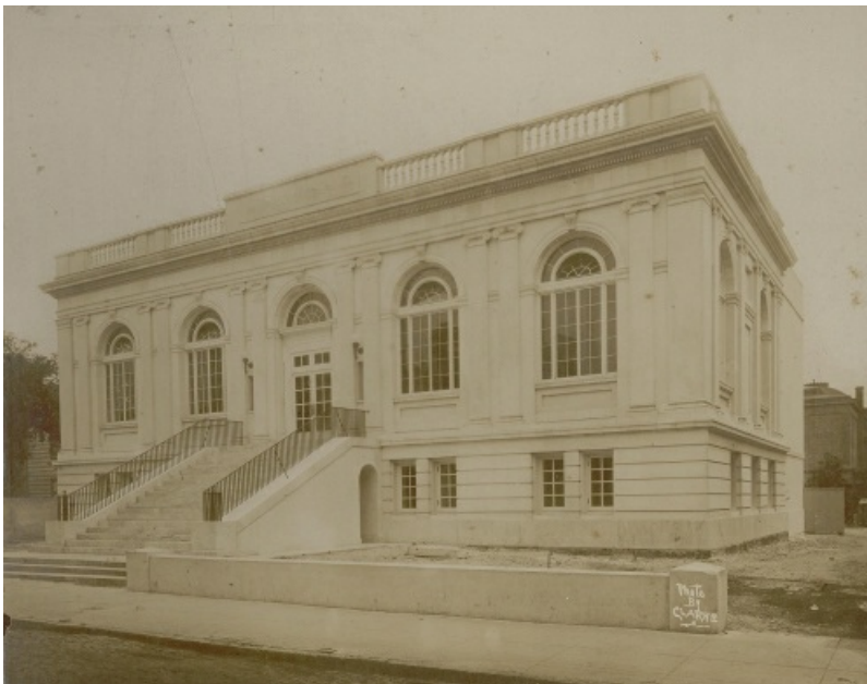
Charleston Library Society, bâtiment du 164 King Street en 1914