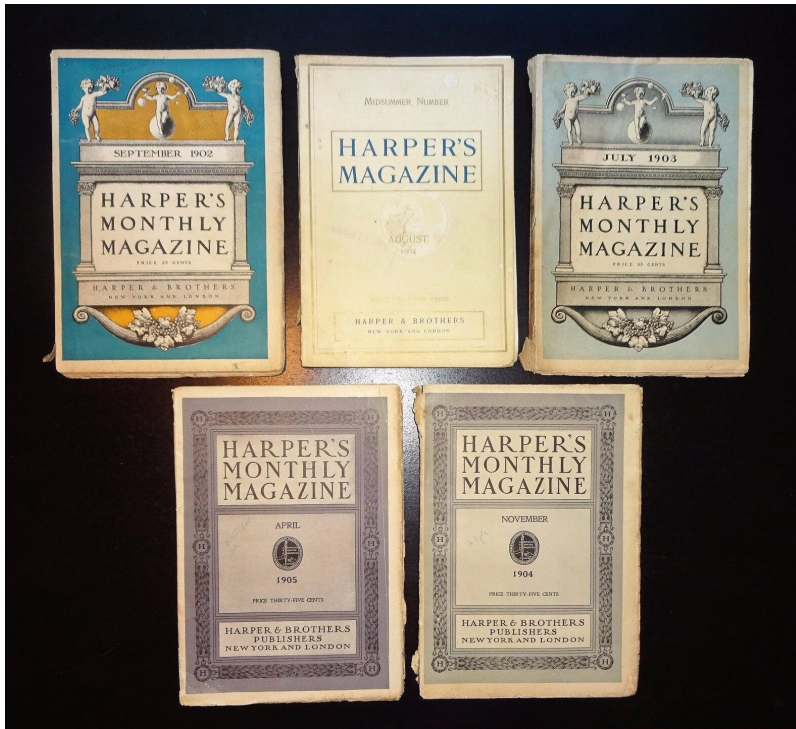
Harper's Monthly Magazine , exemplaires parus au début du 20ème siècle

marché des magazines et l'édition classique, les agents américains investirent le marché du livre plus tard, se concentrant longtemps sur la presse périodique, plus lucrative. Watt, quant à lui, alternait services rendus aux éditeurs et services rendus directement aux auteurs, obtenant des contrats de publication auprès des éditeurs et auprès de revues, à la fois aux États-Unis et en Angleterre. The English Illustrated Magazine en Angleterre, Harper's Weekly et Harper's New Monthly Magazine à New York accueillirent notamment les textes de Dickens, W.M. Thackeray, ou George Eliot. Les contrats de cette fin de siècle attestent déjà la dissociation des droits premiers, dérivés et annexes.