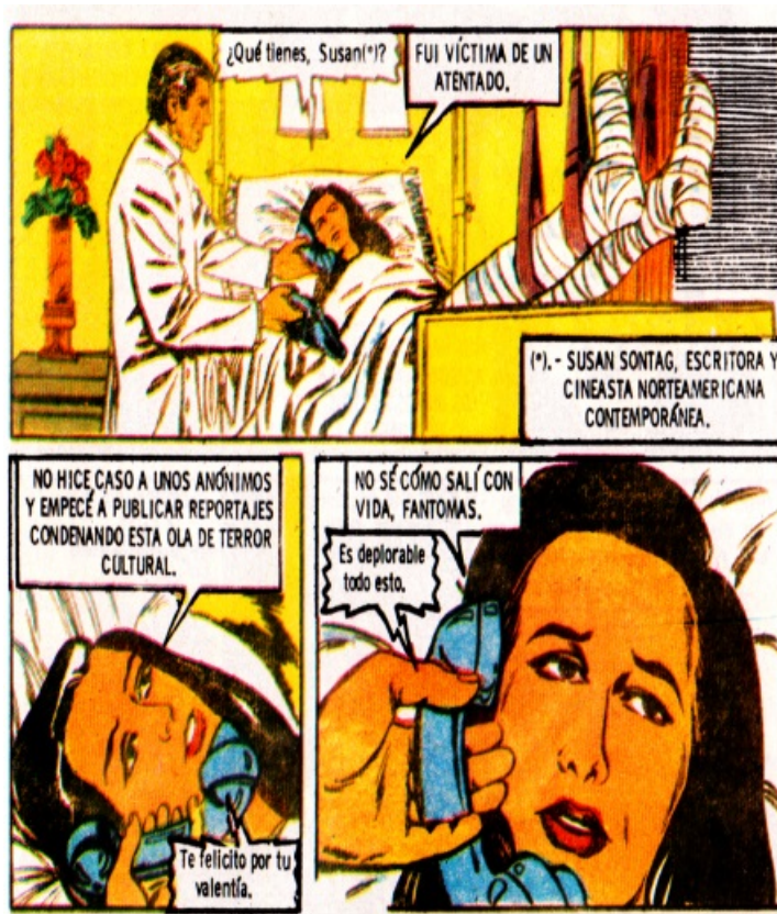
Estória em quadrinhos de Julio Cortázar

Fuente : Susan Sontag Papers (Coleção 612) - Library Special Collections, Charles E. Young Research Library, UCLA