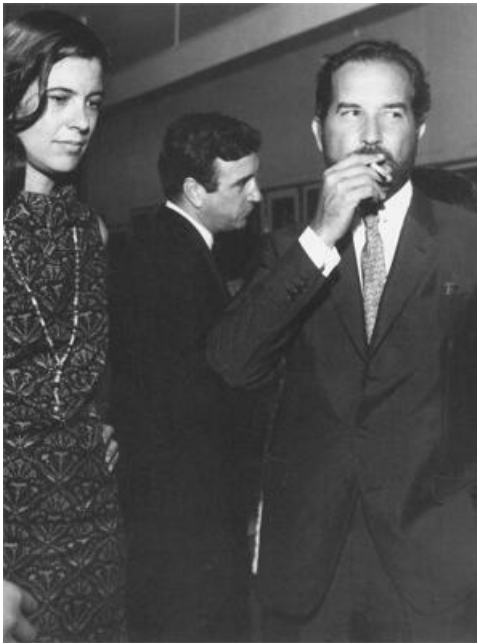
Susan Sontag com Carlos Fuentes - Anos de 1960

Fuente : Susan Sontag Papers (Coleção 612) - Library Special Collections, Charles E. Young Research Library, UCLA