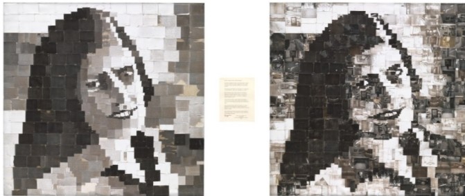
Robert Heinecken. The S.S. Copyright Project: "On Photography" , 1978