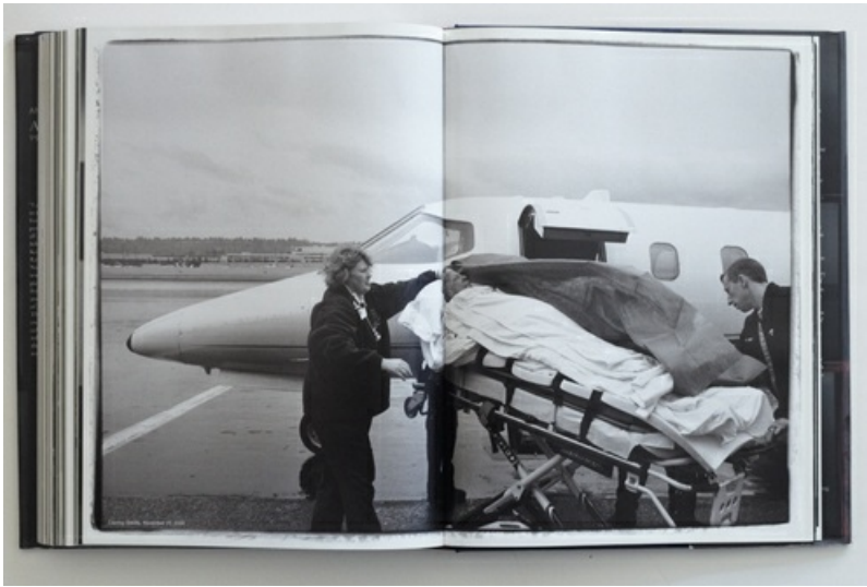
Fotografia de Annie Leibovitz. Leaving Seattle, November 15, 2004

para o reconhecimento dela como uma referência moderna para sucessivas gerações.