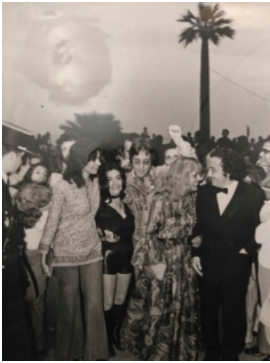
Susan Sontag com John Lennon e Yoko Ono - Anos de 1970

Fuente : Susan Sontag Papers (Coleção 612) - Library Special Collections, Charles E. Young Research Library, UCLA