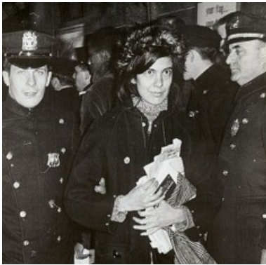
Susan Sontag no protesto contra a Guerra do Vietnã - 1968