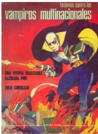
Fantomas contra os vampiros multinacionais , de Julio Cortázar