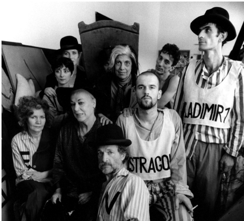
Susan Sontag com o elenco da peça de teatro Esperando Godot em Sarajevo

Fuente : Moser, Benjamin. Sontag: vida e obra . São Paulo: Companhia das Letras, 2019, p. 729.