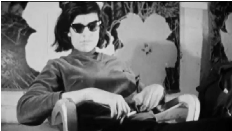
Susan Sontag fotografada por Andy Warhol - "Teste cinematográfico"

Fuente : Susan Sontag Papers (Coleção 612) - Library Special Collections, Charles E. Young Research Library, UCLA