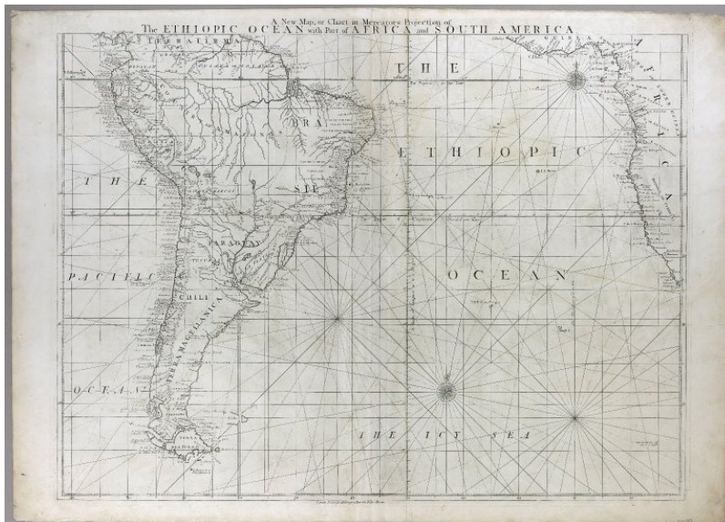
"Proyección del Océano etiópico junto a partes del África y de América del Sur", mapa publicado en Londres entre 1777 y 1780; Jhon Carter Brown Map Collection, Brown University.