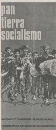
Un manifesto dei contadini cileni

Scrivere su Cuba, sul suo continuo processo rivoluzionario, sulla sua continua militanza continentale, significa, oggi più che mai, scrivere sulla lotta di liberazione non armata e armata, di cui la prima non esclude la seconda perché può necessariamente diventare armata (come compagni cileni precisano), che si sta svolgendo nei paesi latino-americani contro l'imperialismo e il neocapitalismo Usa, contro la presenza della Cia, contro le oligarchie nazionali strettamente vincolate a essi. Lotta per il socialismo, in un durissimo e sanguinoso scontro di classe, che rappresenta il salto qualitativo politico oggi chiaramente significante della lotta stessa. Di questa unità continentale tra Cuba socialista e gli altri paesi è testimone recente il compagno del P.C. cileno Volodia Teitelboim, il quale parlando prima del comandante Eidel Castro nel X anniversario della vittoria cubana di Playa Giron, celebrato in Avana il 19 aprile, afferma: « Siamo coscienza che se Cuba non avesse iniziato la strada al socialismo nei nostri paesi, non sarebbe stato concepibile l'esito rivoluzionario del popolo cileno. Perché senza il vostro trionfo a Playa Giron, tanto meglio noi avremmo ottenuto le vittorie del 4 settembre del 1970 e del 4 aprile del 1971 » (le due vittorie elettorali per le quali l'unità popolare con il presidente Salvador Allende conquistò il governo e iniziò la lotta per la conquista del po-