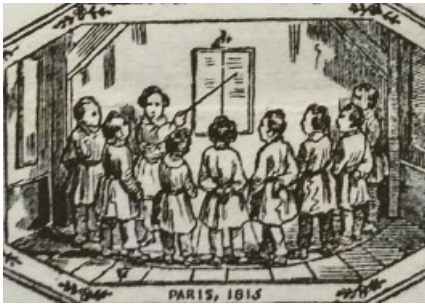
Imagem extraída da capa do Bulletin de la Société pour l'instruction élémentaire , Tome X, Paris, 1838.